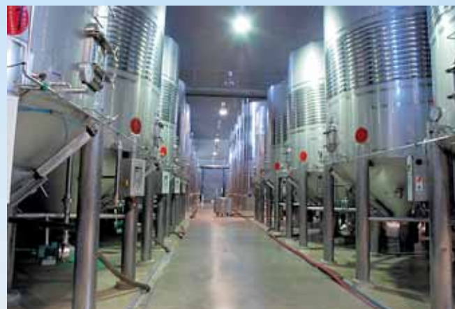
FABRIKK: Vinen gjærer på enorme tanker i fabrikkhallen, og prosessen overvåkes nøye ved hjelp av moderne teknikk.