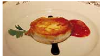
OST: Et stykke chèvre stekt i olivenolje - utsøkt som tapas.

har familien også etablert seg i tre andre distrikter, og eier store vinmarker i La Mancha, Rioja, Castilla-La Mancha og Rueda. Bare i La Mancha høster de tre millioner kilo druer i året.