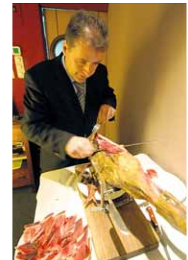
SKINKE: De berømte spanske skinkene skjæres opp ved bordet, og serveres gjerne sammen med litt Manchego-ost. En annen berømt mat fra La Mancha.

Spania sliter på grunn av finanskrisen, og har rundt 20 prosent ledighet for tiden. Men det preger ikke Madrid nevneverdig. Sammenlignet med Oslo virker Madrid som en trivelig by med hyggelige mennesker, som har god tid til å slå seg ned på en uterestaurant eller en tapas-bar for å nyte livet. Ingen raver rundt i gatene, og tiggere er nesten ikke å se. Men for matglade ranværing på storbybesøk, er fristelsene mange. De berømte skinkene, spekepølsene, ostene, vinen, oli-