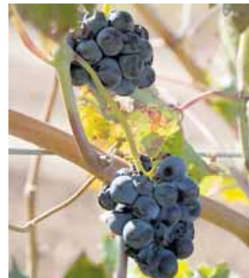
VINDRUER: Hele 14 forskjellige vindruer dyrkes på 421 hektar ved Finca Antigua.

Denne filosofien har fulgt firmaet siden også. Etter starten i Rioja,