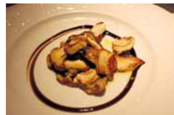
ENKELT: Tapas er enkle, men smakfulle retter. Her en sopp med smak av balsamico.