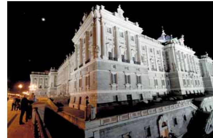
MEKTIG: Madrid bærer preg av at Spania har en mektig historie - her representert ved det kongelige slottet.