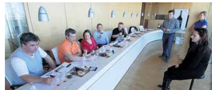
SMÅK: Fra smakerommet til Finca Antigua. Representanter fra Rica-hotellet på Hell tester vin de vurderer å kjøpe inn.